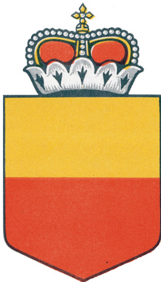
Национальная эмблема Лихтенштейна